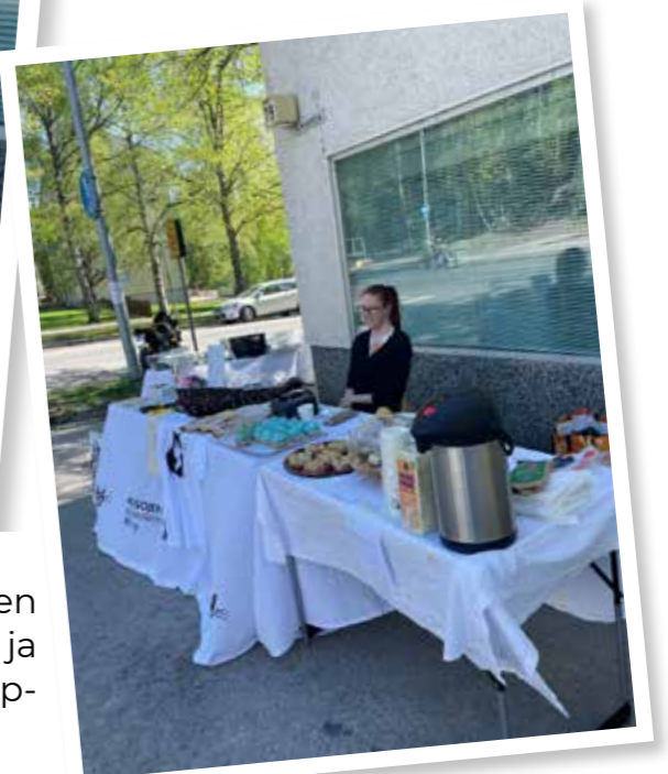
Toukukuussa pidettiin vuoden ensimmäiset Avoimet ovat ja osallistuttiin Raholan pihakirp- pikseen.