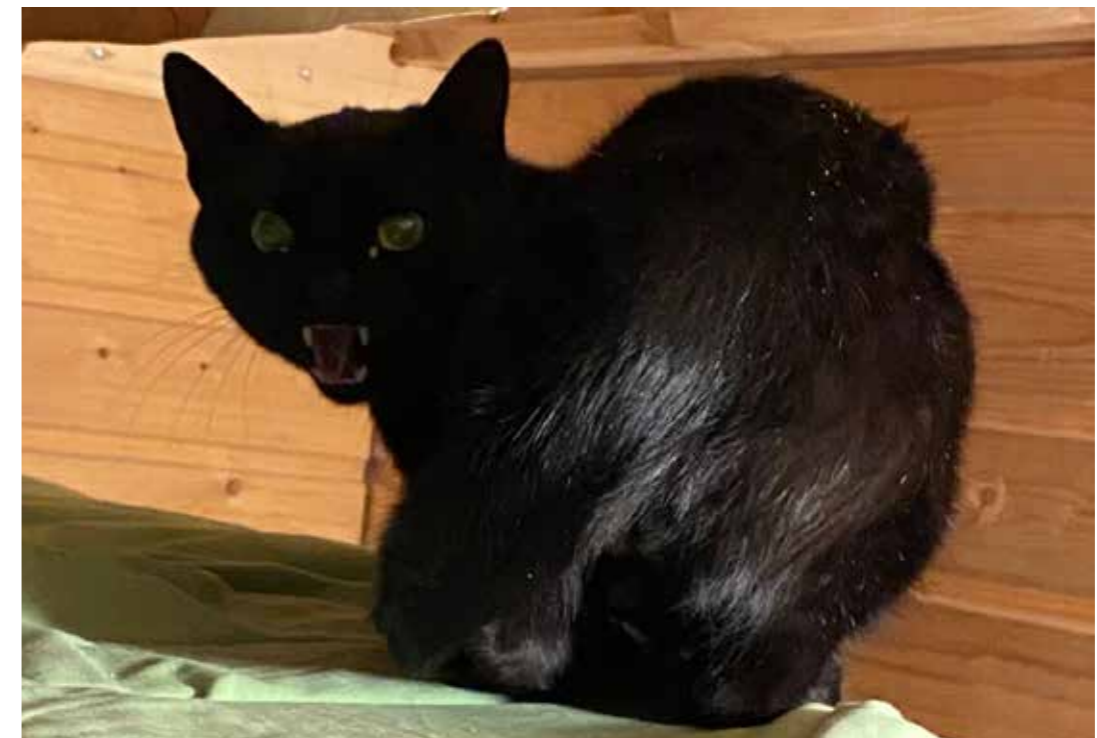
Anna minulle nyt tilaa!

Myöhemmällä iällä kissa tunnistaa tutut eläinlajit eläinlajin ominaisuuksista, mutta jokaiseen uuteen tuttavuuteen tulee silti tutustuttaa rauhassa hajujen vaihdon avulla, sillä jokainen uusi tuttavuus on kuitenkin yksilöllinen, vaikka yleisesti eläinlajista olisi hyviä kokemuksia. Tämä tarkoittaa siis käytännössä sitä, ettei jokainen uusi ihmis- tai vaikka koiratuttavuus ole automaattisesti ystävä, vaikka herkkyyskauden hyviä kokemuksia olisi kissalla paljon. Yleensä herkkyyskauden aikaikkunan ulkopuolelle jäävät eläinlajit ovat joko