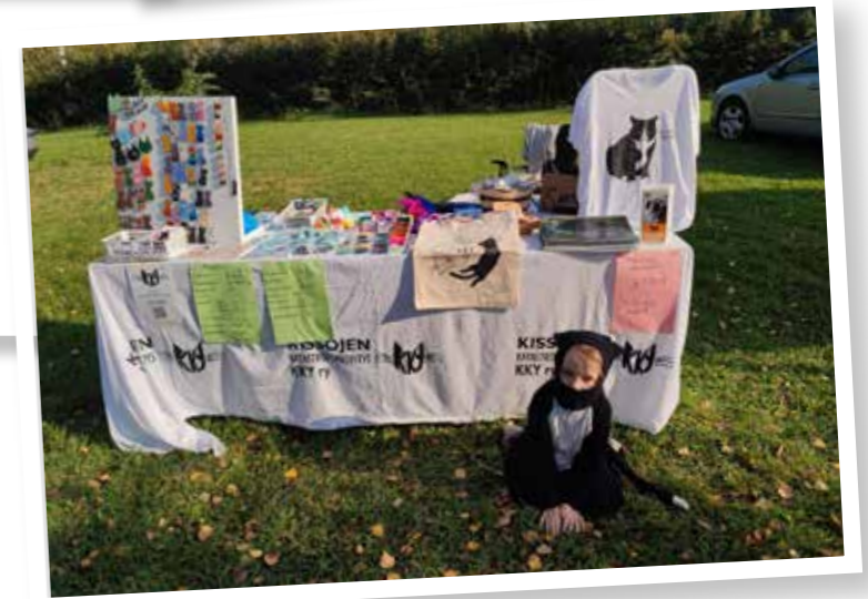
Knuutilan syysmarkkinoilla mukana oli pieni Therian-kissa.