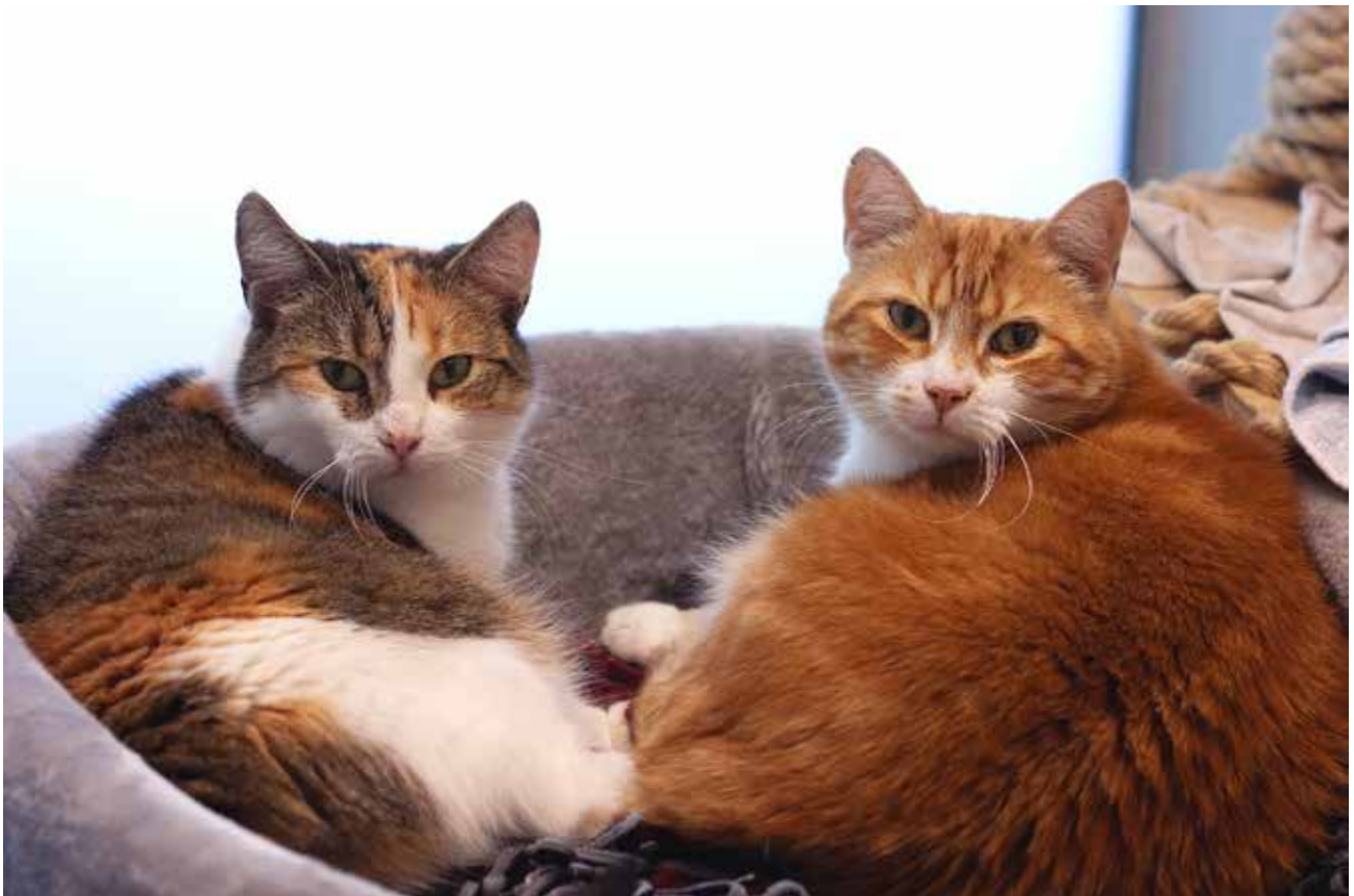
Kuvat: Annukka Uitto

Jäsenrekisterin tietosuojaselostetta koskeviin kysymyksiin vastaa hallitus osoitteessa hallitus@kky-ry.fi