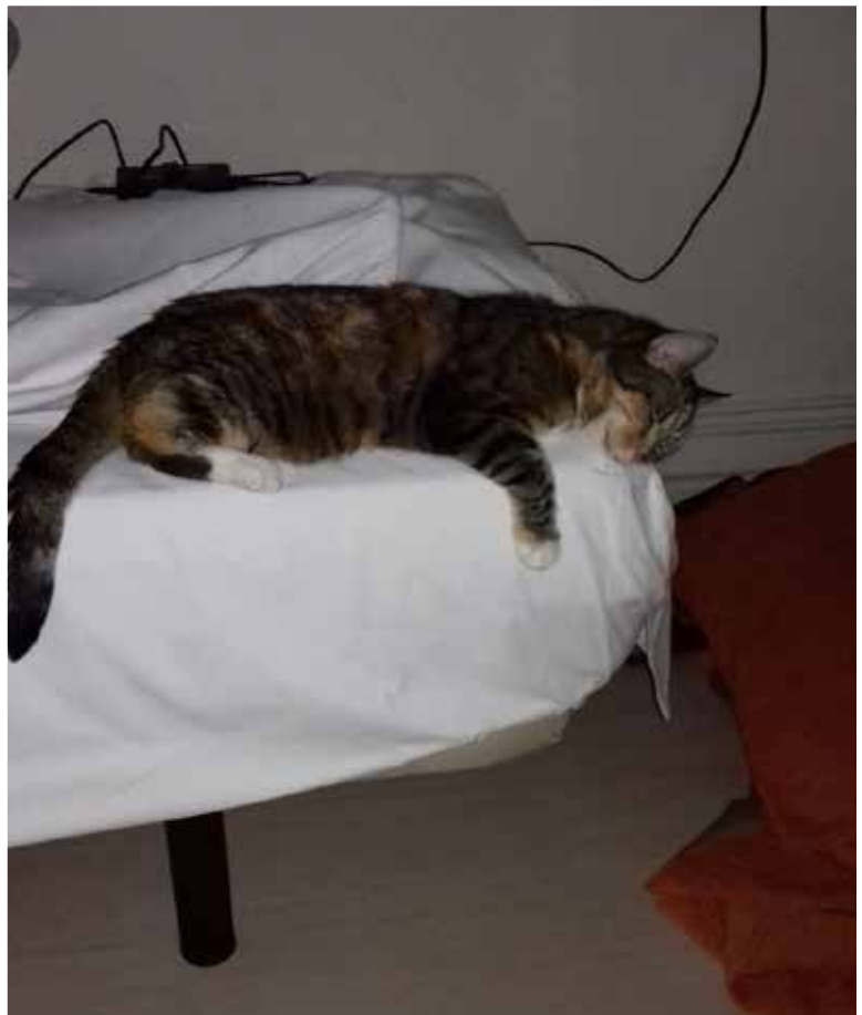
Purr Bailenissa hotellissa 370 km:n matkan jälkeen.