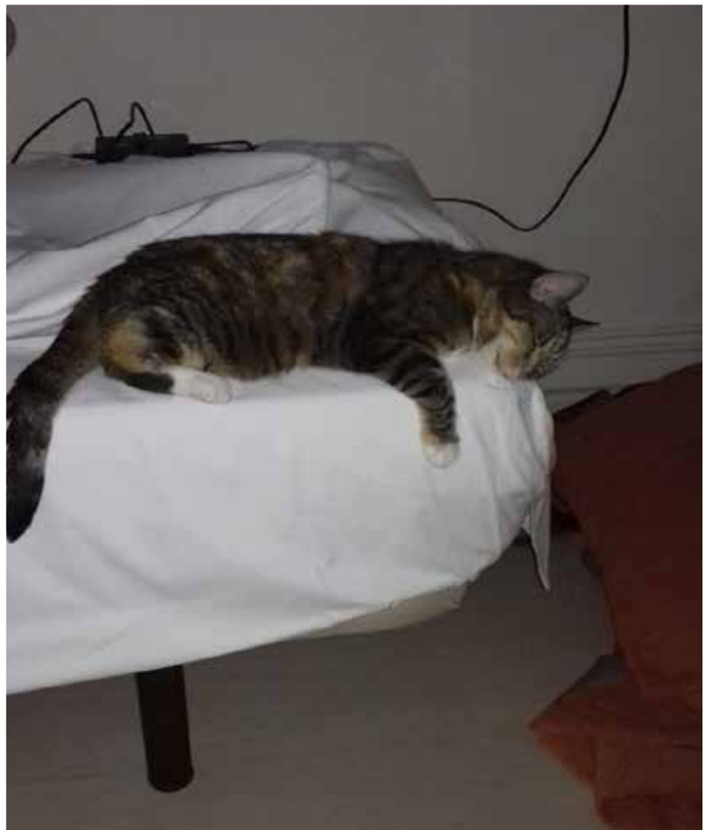
Purr Bailenissa hotellissa 370 km:n matkan jälkeen.